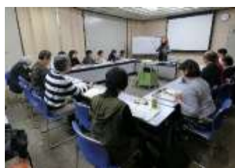
平成30年度後期講座 『イタリア語 中級』