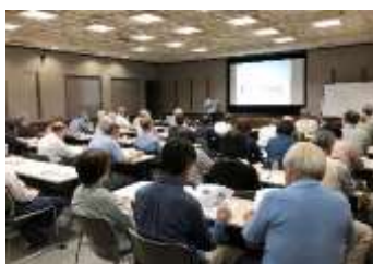
平成30年度後期講座 『アリストテレス哲学入門』

『循環器系疾患の治療や災害時医療で重要な薬の話』、『日本の名城(1)』など31講座