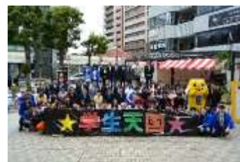
八王子地域合同学園祭 ★学生天国★