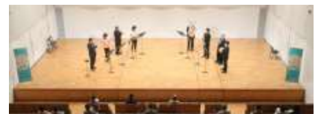
八王子音楽祭 「アフタヌーンコンサート Vol.15」

イ. 一流の芸術実演団体やアーティストによる質の高い芸術文化のコンサートを実施します。