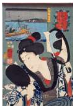
「浮世絵にみる江戸美人のよそおい」より ポーラ文化研究所蔵