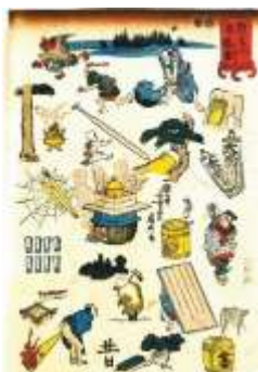
「なぞなぞ絵解き 判じ絵展」より 個人蔵