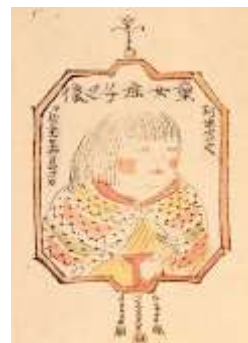
「岸田劉生と木村荘八」より 笠間日動美術館蔵