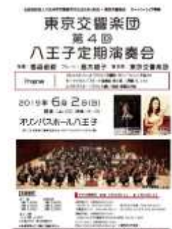
東京交響楽団 「第4回定期演奏会」