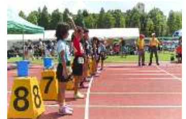
はちおうじダッシュ！

コニカミノルタ陸上競技部及びJ R 東日本ランニングチームの指導のもと、子どもたちの健全育成を目標に掲げ、年間24回以上のジョギングスクールを実施します。