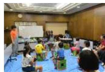
夏休み子どもいちょう塾