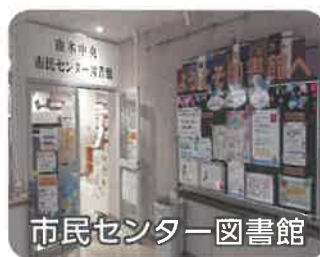
市民センター図書館