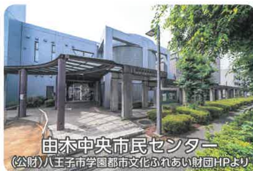
由木中央市民センター (公財)八王子市学園都市文化ふれあい財団HPより