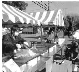
焼きそばをどうぞ

協力も頂き、チャレンジゲームとしての「ストラックアウト」と「輪投げ」コーナーが開催され、見事にパーフェクト賞が出ました。