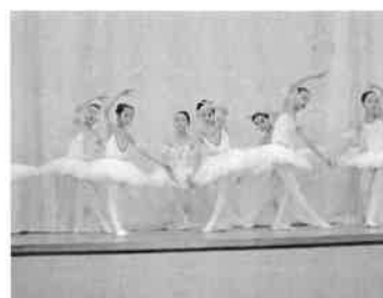
クラシックバレエの美

その後にも、ジャズ演奏、家族バンド演奏や、初めての参加のクラシックバレエなどで大いに盛り上がりました。展示関連では、絵画、写真、パッチワークキルトなど、皆さんの力量ある作品に目の保養をさせて頂きました。