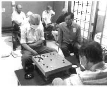
碁楽会を楽しんで