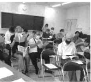
令和6年度の予算は...

前年度事業報告の中では、当市民センターの利用者が令和5年度単年度では、約8万2千人であり、開設以来の累計が320万人となりました。