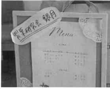
中央大学 製菓の銀月

カラオケ会場では5グループ48名の方が、ご自慢のノドを披露されました。さても童謡まで飛び出し、同好の皆さん同士が一緒にあって堪能なされていました。