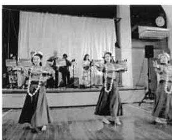
演奏付きのフラダンス

その後、体育室においては、バンド演奏、久し振り出演のマジックショー、フラダンス、三味線、和太鼓などが披露された後に、今回も特別公演と