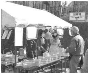
由木ではメカイです

駐車で、久しぶりの焼きそばの味も楽しめて、コルク弾を撃つ射的に遊んで、環境にやさしい割竹で編んだ目籠（めかご；メカイ）の実演販売も見られ、ジャム、小物、食器なども早々の内に完売となりました。