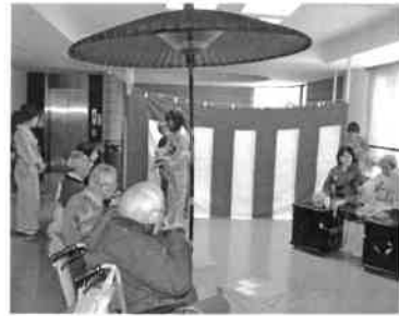
立礼式で点てる野点

恒例となった古本市に人気が集まり、皆さんからご提供頂いた本が買い求められ、収益金が八王子市社会福祉協議会に寄付されました。また、図書室内では子供向けの読み聞かせや、紙芝居も行なわれていました。