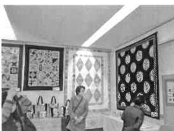
パッチワークキルトなど

その後にも、ジャズ演奏、家族バンド演奏や、初めての参加のクラシックバレエなどで大いに盛り上がりました。展示関連では、絵画、写真、パッチワークキルトなど、皆さんの力量ある作品に目の保養をさせて頂きました。