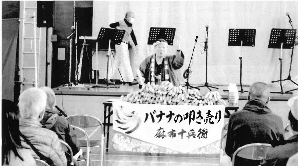
「よし、売った」契約成立！第34回由木東市民センターまつり 特別公演 麻布十兵衛氏「バナナの叩き売り」

八王子市鹿島111の1 由木東市民センター内 TEL 042 (675) 5911 発行日 令和6年8月29日