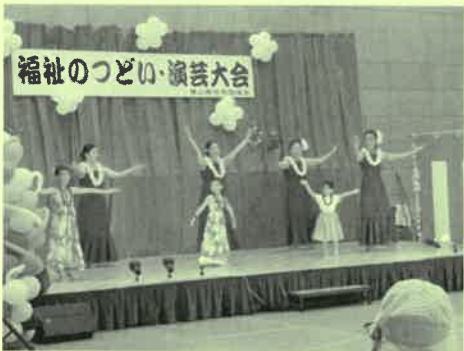
子どもといっしょにフラダンス