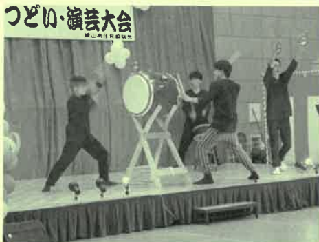
八王子太鼓会(はちはち)