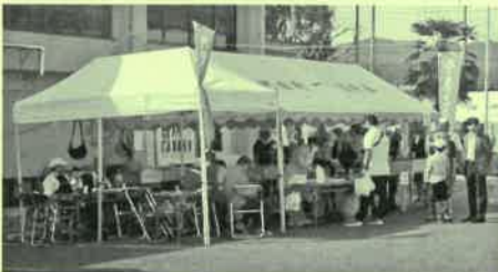
館町町会 ヤキソバ、フランクフルト、コンニャク