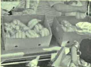
寺田町町会 バナナ、みかん