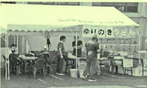
ゆりのき台自治会 うどん屋さん、 ただいま準備中