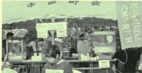
ボーイスカウト ポップコーンと綿菓子