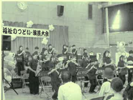
栢田中学校吹奏楽部

日時 令和6年10月17日(木) : 設営準備日、天気: 晴 令和6年10月18日(金) : 設営準備日、天気: 小雨 令和6年10月19日(土) : 第1日目、 天気: 晴 令和6年10月20日(日) : 第2日目、 天気: 晴