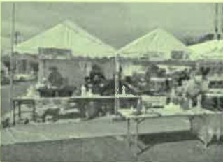
館町町会 ヤキソバ、フランクフルト、コンニャク