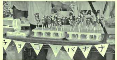
梶田町大巻町会 チョコバナナ