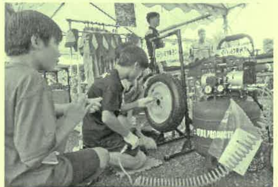
トヨタ東京自動車大学校 ただいまタイヤ交換のタイムトライアルに挑戦中