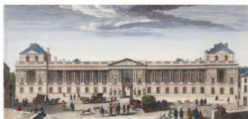
《ルーヴル日曜正面の眺め》ジャック・リゴー

13,000点の銅版画を有するルーヴル美術館のカルコグラフィール室。その起源はルイ14世統治下にまで遡り、20世紀以降も現代作家による新作を加えながら、コレクションはさらに拡充しています。本展では、日本の特別公開のため当時の版を使い刷られた銅版画100点余りをご紹介します。